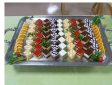
▲ケーキもありましたよ