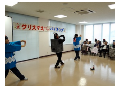
▲クリスマス会では、くまもん体操や、ちょんかけごま、バナナの叩き売りなどで楽しみました！