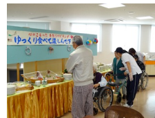
▲美味しそうな料理がいっぱい

12月21日に当院の入院患者さんを対象にした、クリスマスバイキング&クリスマス会を実施しました。バイキング形式の美味しい料理を味わいながら、昼食がすんだ後は、楽しいクリスマス会を行いました。患者さんも、非常に楽しい時間を過ごされた様子でした。