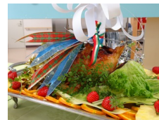
▲ローストチキンです