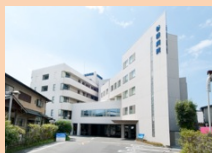
通所リハビリテーションセンター 甲佐リハ