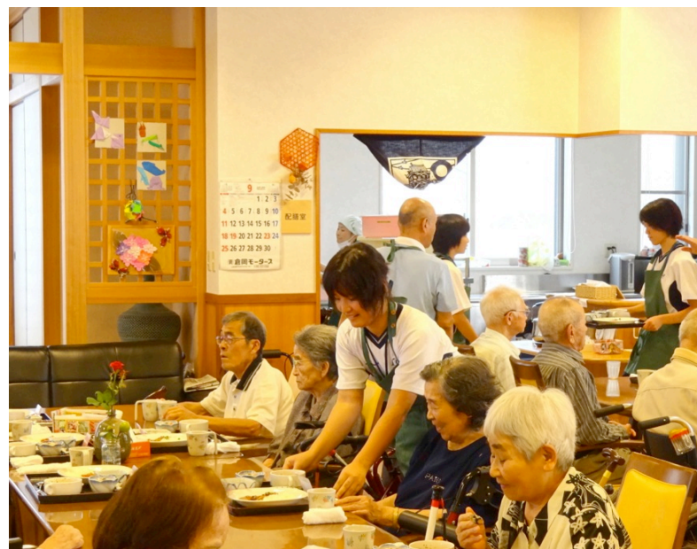
今月の表紙：甲佐中学校の職場体験の様子