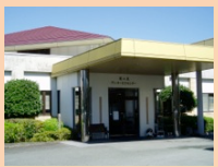
桜の丘デイサービスセンター