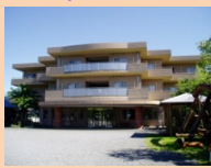
ケアハウス桜の丘