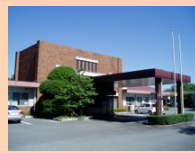
特別養護老人ホーム桜の丘