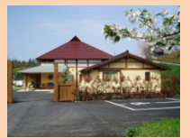
グループホーム桜の丘