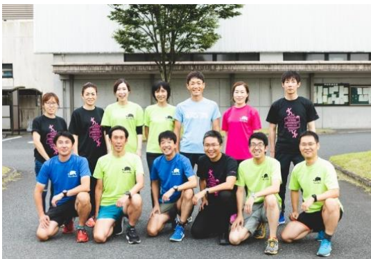
▲ランナーズのメンバー。最大60人程度いるそうです。ぜひ Magazine BO をご覧ください

月1程度ですが地元で練習を行っています。バレーだけでなくバドミントンも同時開催しています。