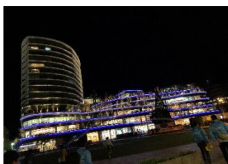
ブルーにライトアップ