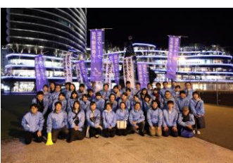
最後に集まって記念撮影