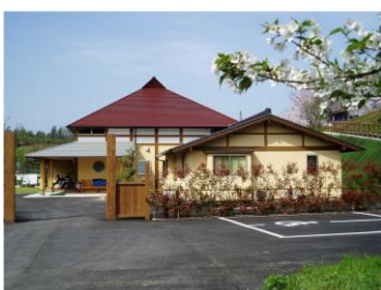
グループホーム桜の丘