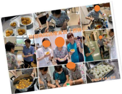
▲また患者さんには、今回の様子を上記のように印刷して渡しました。