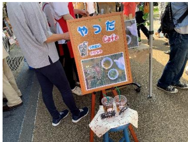
飛ぶように売れたドリンク