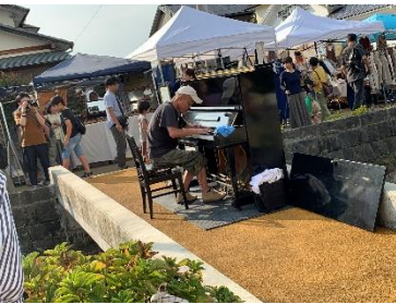
当院のピアノを路上にセット なんとバ イリンとのコラボも！