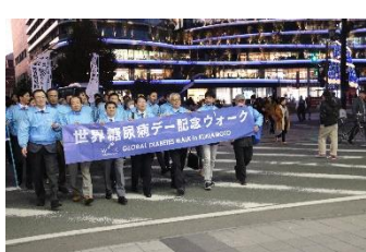
こんな感じで歩きました