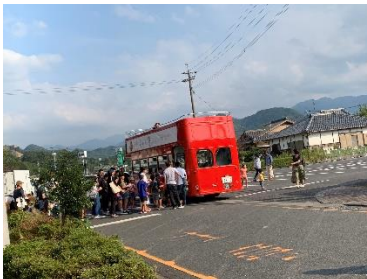
人気のロンドンバスツアー 甲佐周辺を回ります

毎年10月の第1日曜日に行われる甲佐町最大のイベント「甲佐蚤の市」に今年も出展しました！ 当院は「谷田病院が考えた健康茶ドリンク」を販売しました。 晴天にも恵まれ、用意していた分はすべて完売となりました！ 暑い日となった事もありますが、ドリンクを飲まれた方が「あ、おいしい！」と言われる事が非常にうれしかったです。暑い中、来場された方はありがとうございました。