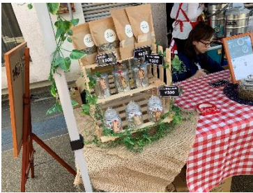
お茶パックも販売