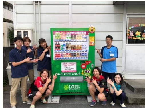
▲当院敷地内に専用自販機が設置されました。売り上げの一部が応援資金となります