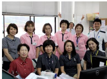
谷田病院訪問看護ステーション 谷田病院居宅介護支援センター