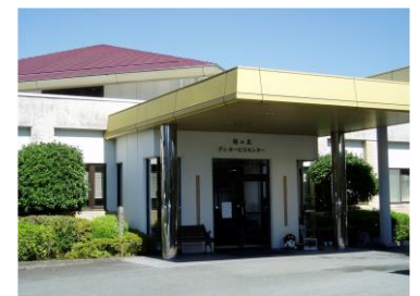
桜の丘デイサービスセンター