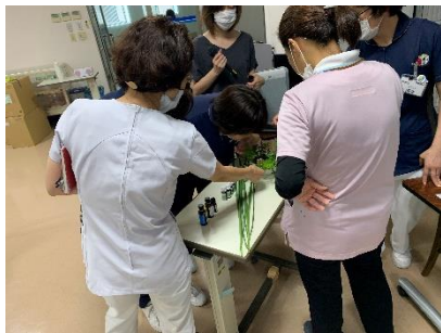
▲皆で香りを楽しみました