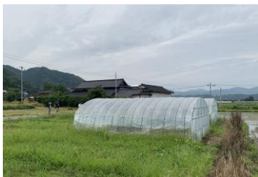
▲草が茂っているのは梅雨時期で わざと雨を吸わせる為との事