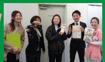
▲商品もしっかりアピール