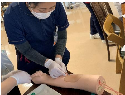
▲腕からの注射はもちろん