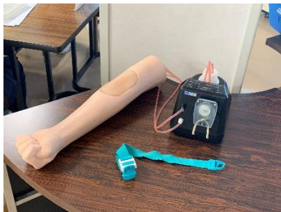
▲この機器を使用しました