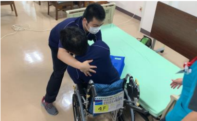
▲こちらはトランスファーボードを使った車椅子移乗です