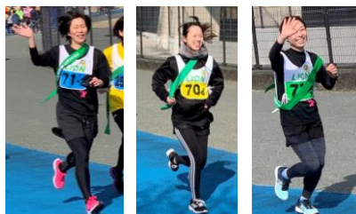
▲みんな頑張ってます