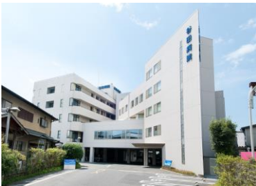
通所リハビリテーションセンター甲佐リハ