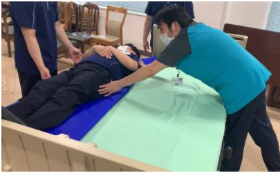
▲スライディングボードを使うとスルスルと滑るように移乗できます

当院では力を使わない介護「ノーリフト」に力を入れています。 今回、現場スタッフ向けに介護道具を使ったノーリフト研修を行いました。 YouTubeの「やつだチャンネル」にも動画をアップしていますので、ぜひご参照下さい。