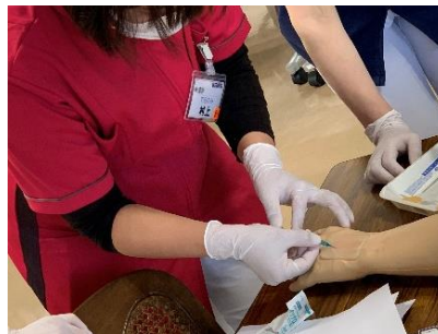
▲手の甲からの体験も行いました