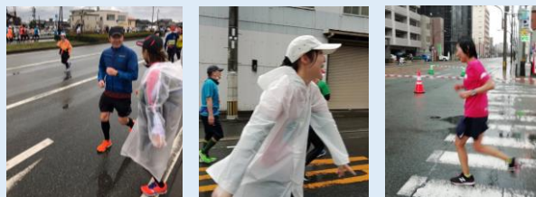
▲天候は最悪ですが女性陣も含めて快調な走りです！

悪天候の影響もあり今年の完走率は低かったようですが、出場された職員の皆さんは無事に完走出来たようです。選手の皆さん、お疲れ様でした！