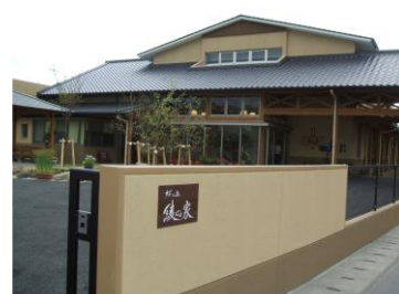
桜の丘 小規模多機能型ホーム 綾の家