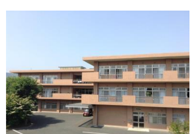
老人保健施設 なごみの里