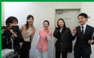
▲福岡のカウテレビジョンさん