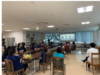
▲2回とも多くの方が参加されました