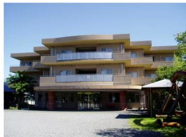
ケアハウス桜の丘