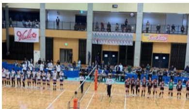
▲対戦相手は福岡春日シーキャッツ よいよ試合開始です