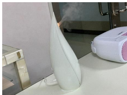
▲部屋に入るといい香り♪