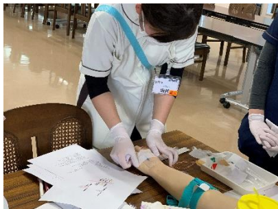
▲チューブ固定まで行います