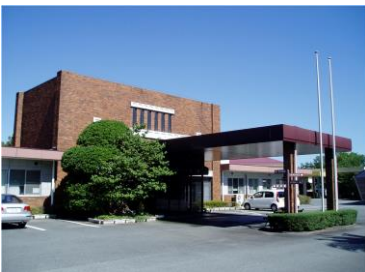
特別養護老人ホーム 桜の丘