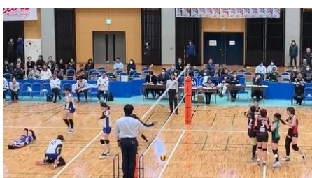
▲初日の試合は2-0で勝利しました！