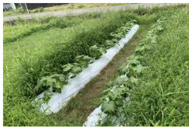
▲オクラのようです