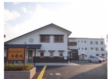
サービス付き高齢者住宅 松樹苑