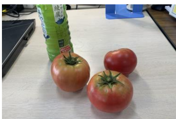
▲無事収穫しました！