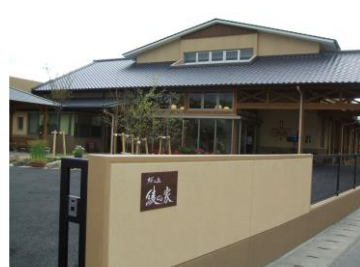
桜の丘 小規模多機能型ホーム 綾の家