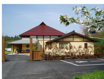
グループホーム桜の丘