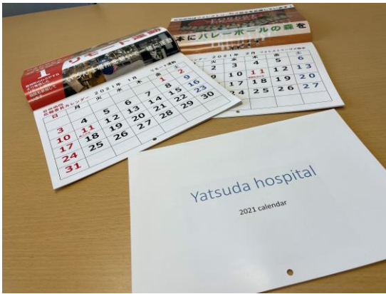
▲今年は今までの手作り感満載な感じから本格的な出来栄えに生まれ変わりました