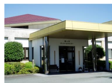
桜の丘デイサービスセンター