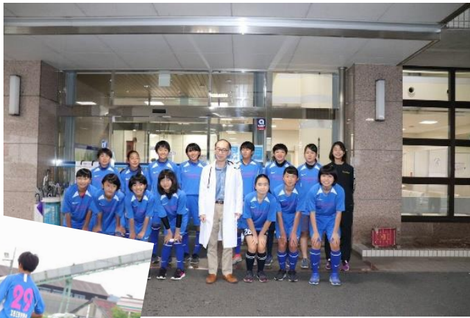
▲当院の理事長と一緒に記念撮影

甲佐町で活躍中の女子サッカーチームFRAGRANTにユニフォームを提供しました。爽やかな青色の真ユニフォームで活動を行っていますので、皆さんも応援よろしくお願ひします。