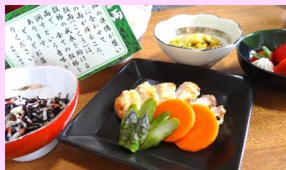
▲穀雨は緑を感じられます。