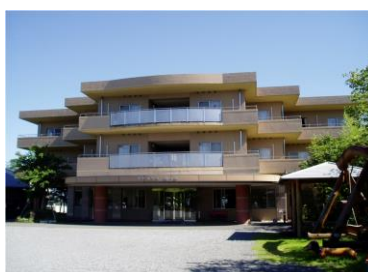
ケアハウス桜の丘