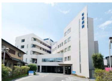
通所リハビリテーションセンター甲佐リハ