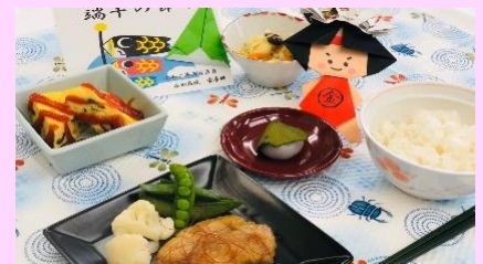
▲端午の節句には小さな柏餅も。