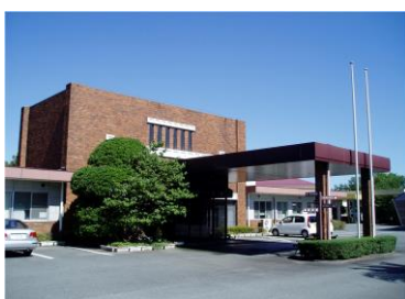
特別養護老人ホーム 桜の丘