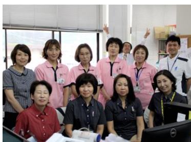
谷田病院訪問看護ステーション 谷田病院居宅介護支援センター