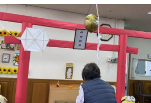
▲谷田神社です。手作りさい銭やおみくじもご用意しました