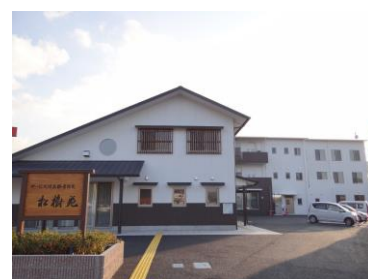
サービス付き高齢者住宅 松樹苑