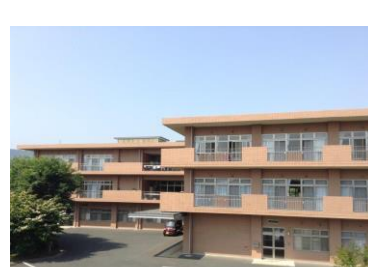
老人保健施設 なごみの里