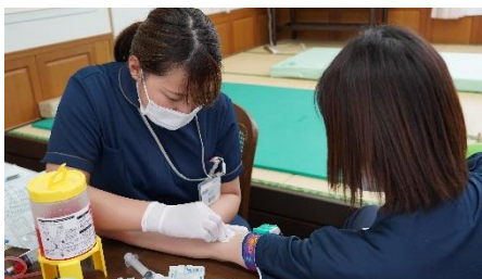
▲職員同士で実践練習も行いました

この日は、採血の実務研修を行いました。注射器を使用する事が看護師のひとつの目標でもあり不安を感じる部分でもあります。じっくり時間をかけて行います。