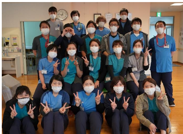
▲リハビリ科スタッフ

また当院では、このPOCで得られた情報に加え、目標とする生活動作を考案したピクトグラムを用いて、病棟カンファレンス(医師・看護師・リハビリ・ソーシャルワーカー・介護福祉士)で情報共有し、より円滑な退院支援に繋がられる様にチーム一眼となって取り組んでおります。