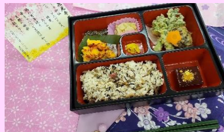
▲お花見弁当で春を満喫。